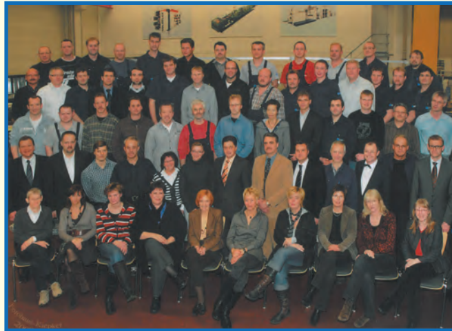
Wir sind Garant.

Besuchen Sie uns auf unserem Stand und lassen Sie sich von der Qualität, Erfahrung und Zuverlässigkeit von GARANT überzeugen.